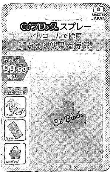
携帯用の16ml入りスプレー

以上減少させ、更に一価銅化合物が残ることで1週間以上抗ウイルス効果を持続する。このほど、奈良県立医科大学の試験で新型コロナウイルスに対しても99・99以上の不活性化効果があることが確認された。